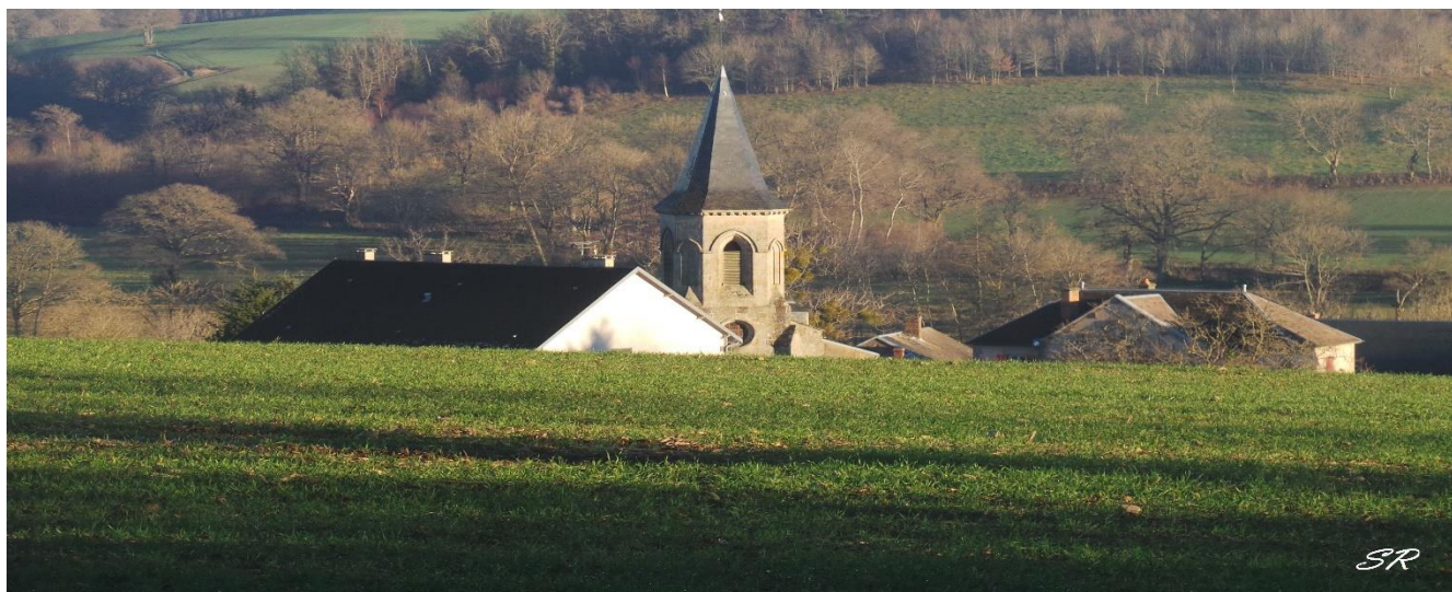
Figure 11L' EGLISE DE GOUTTIERES ET SON CLOCHER CONSTRUIT EN 1861

Balisage Jaune 12.5 km 3h30 ∇ 650 m ∧ 770 m